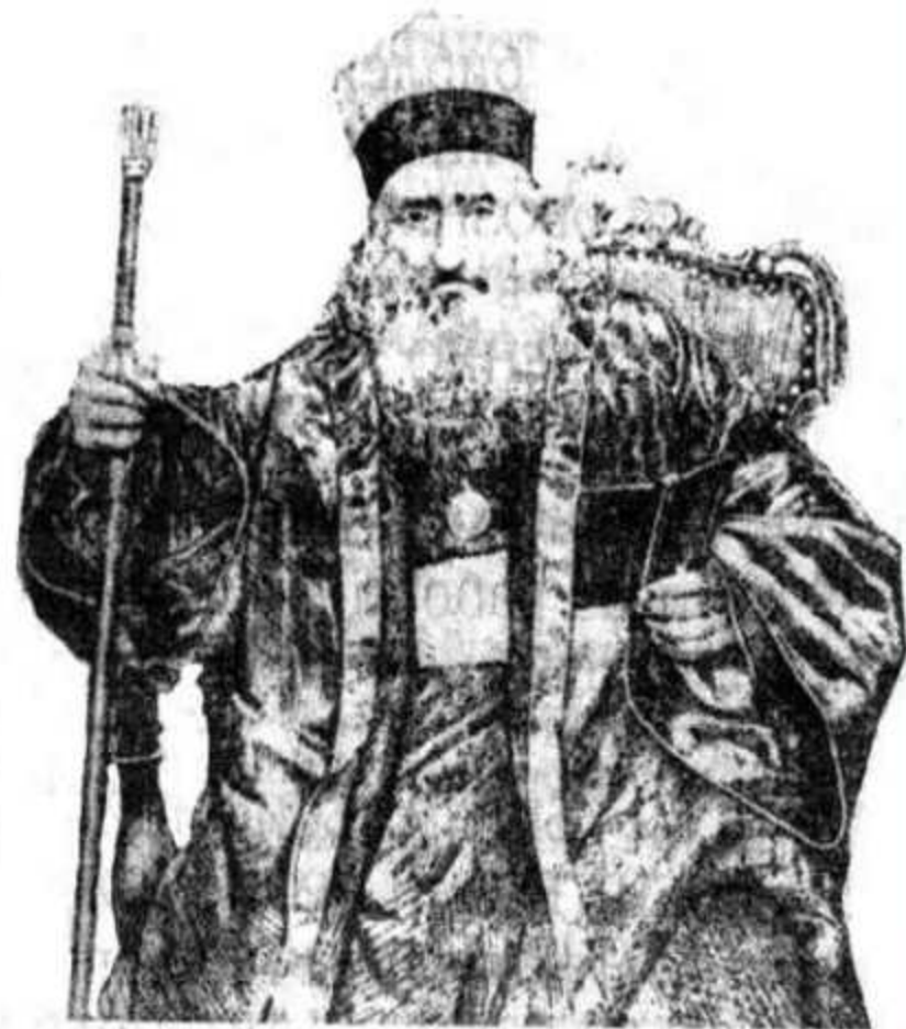
Выдающийся караимский ученый 19 в. и наиболее активный борец за уравнивание караимов в правах был Аврахам Бен Шмуэль Фиркович