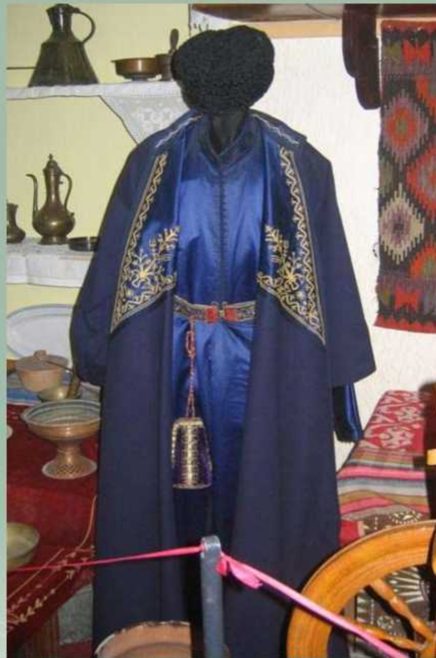
Костюм жениха из Евпаторийского караимского музея